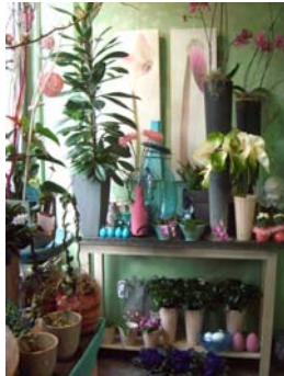
Blumen Prinz Gladbach

Lassen Sie sich nun von dem puren und klaren Ambiente dieser Arztpraxis inspirieren, in der das Element Holz den Beginn des Frühlings auf eine besonders schöne Art ankündigt. (übrigens alle diese Läden s. Fotos wurden durch Feng-Shui Maßnahmen auf ihren Erfolg ausgerichtet)