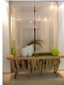
Blumen Hermes Krefeld